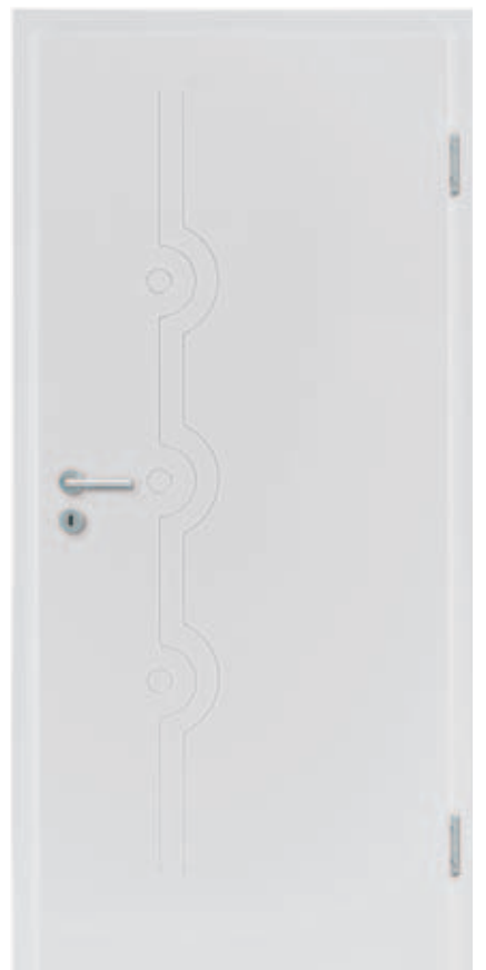
Freestyle 13 WeiBlack