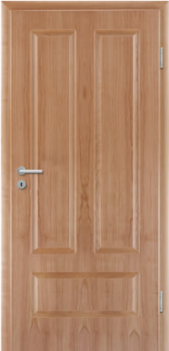
Style 32 / amerikanischer Kirschbaum

Doch etwas anmutiger? Die rechte Tür beweist, dass man schon mit einfachen, schmalen Fräsungen eine große Wirkung erzielen kann. Das hier gewählte Ahorn unterstreicht den eher frischen und modernen Charakter der Tür.