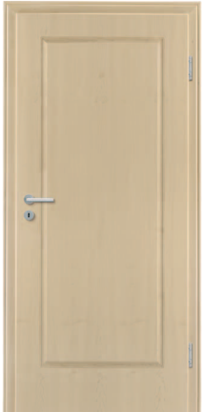
Style 10 / amerikanischer Ahorn