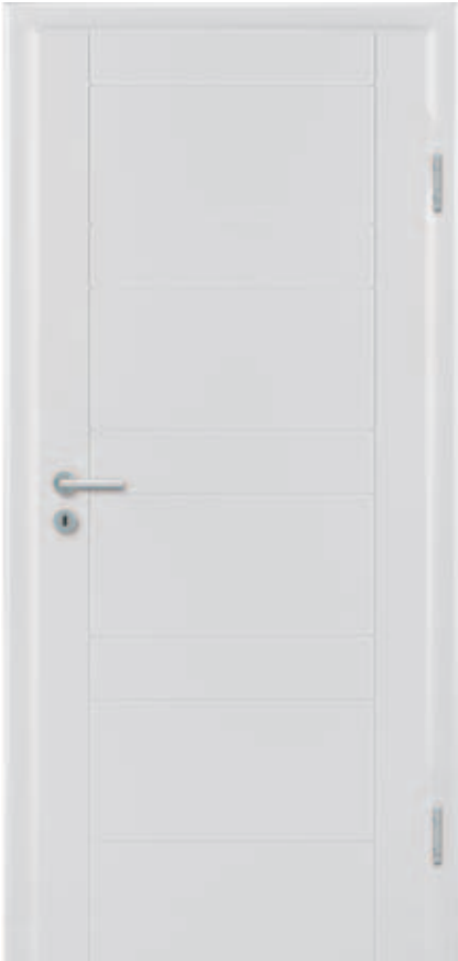
Freestyle 04 WeiBlack