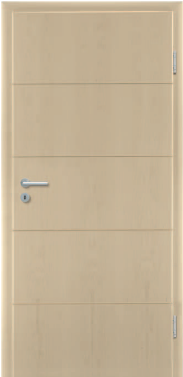
Freestyle 03 / amerikanischer Ahorn

Architekten setzen dieses Modell ein. Das beweist, dass der Ansatz funktioniert. Wenn Sie die Linien dagegen wie bei der rechten Freestyle-Tür nicht als Unterteilung anordnen, schaffen Sie eher eine freie, individuelle und künstlerische Anmutung.