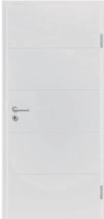
Freestyle 03 WeiBlack