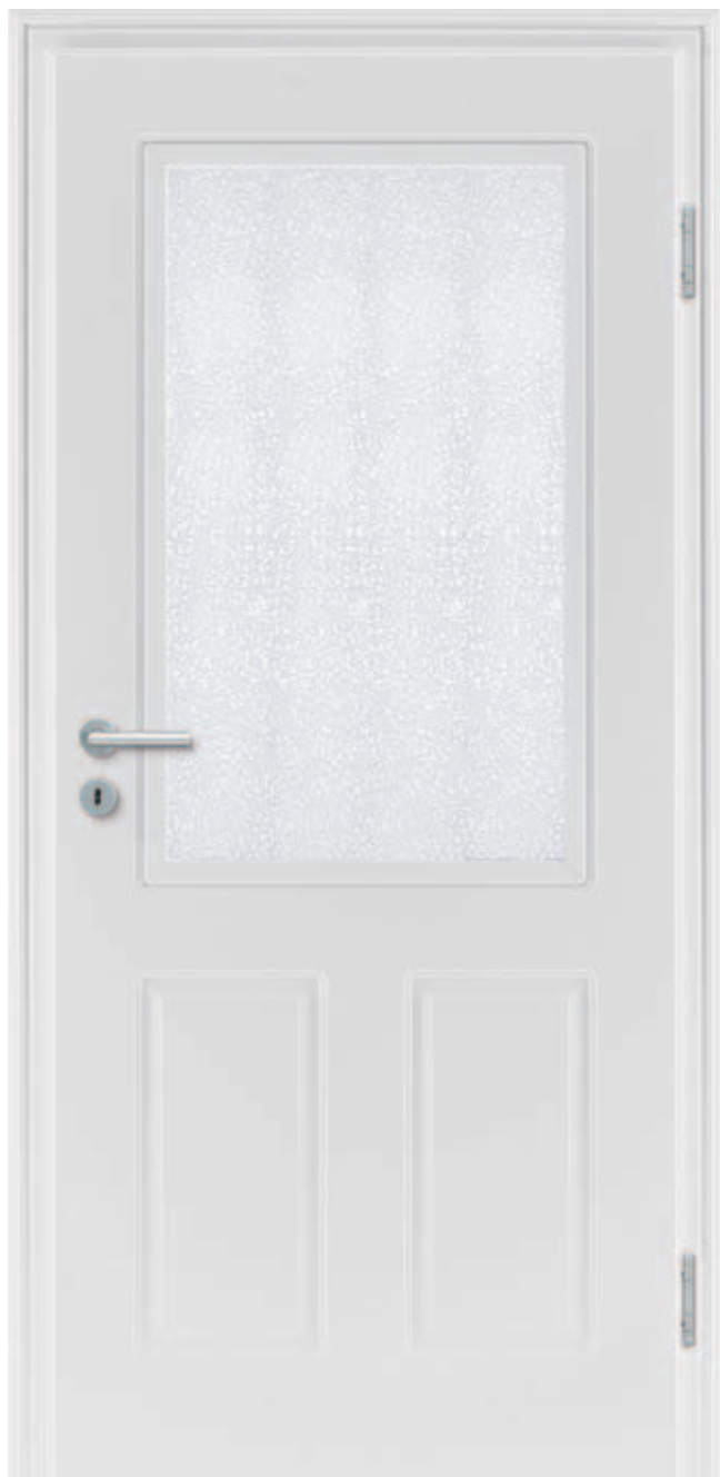
Style 30 Weißlack / SP01 / Glas Eisblume

In Ihrem Raumkonzept dominieren eher runde Formen? Dann verlassen Sie doch die Welt der Ecken und betreten Sie das Land der sanften Rundungen. Die Style lässt Ihnen alle Freiheiten. Ein Beispiel? Rund gefräste Füllungen für die perfekte Tür in einem Jugendstilambiente.