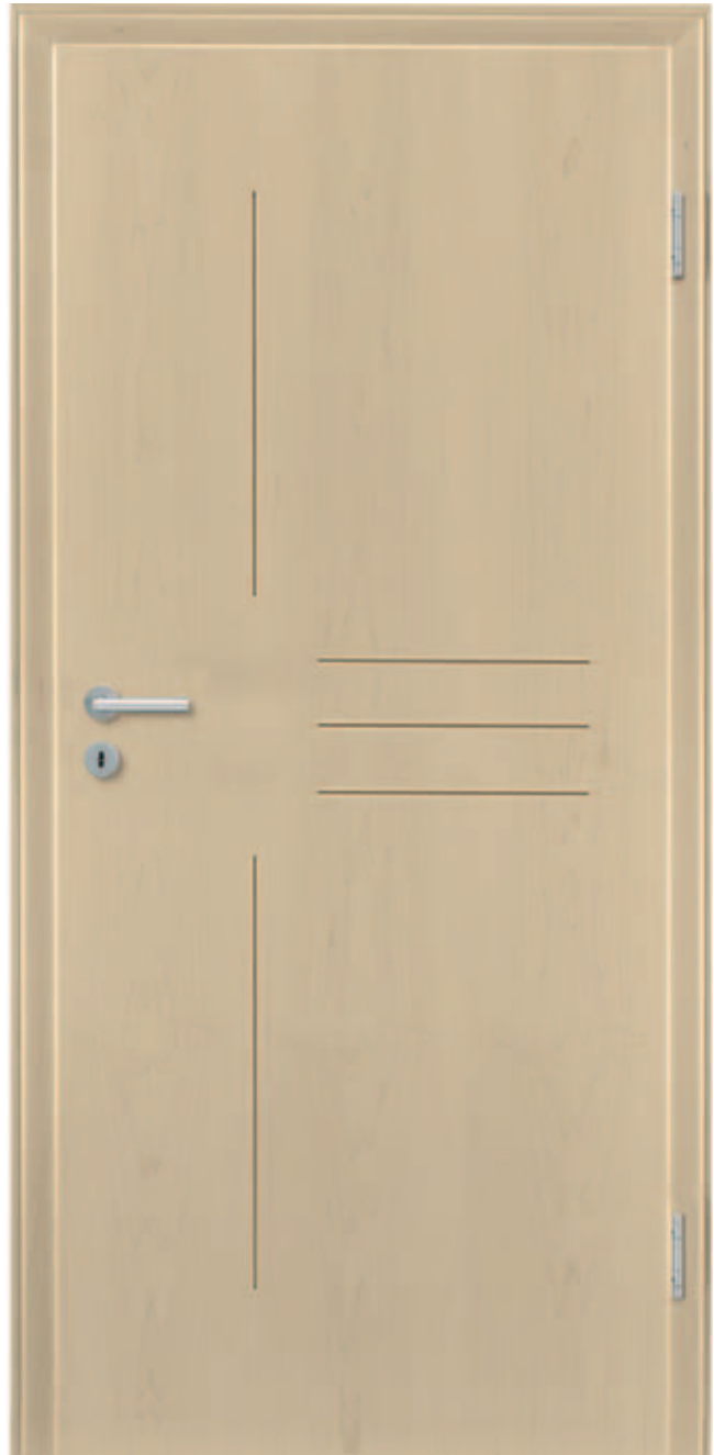
Freestyle 01 / amerikanischer Ahorn