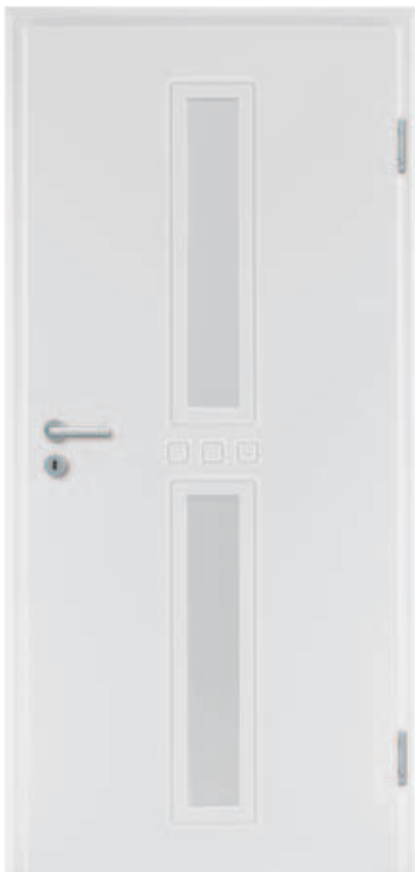
Freestyle 16 WeiBlack / 2SP01 / Glas Float