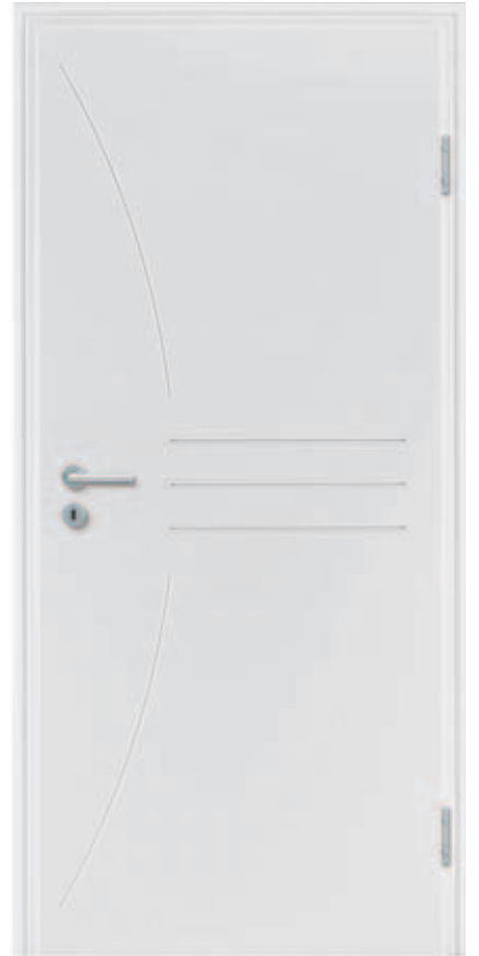
Freestyle 02 WeiBlack