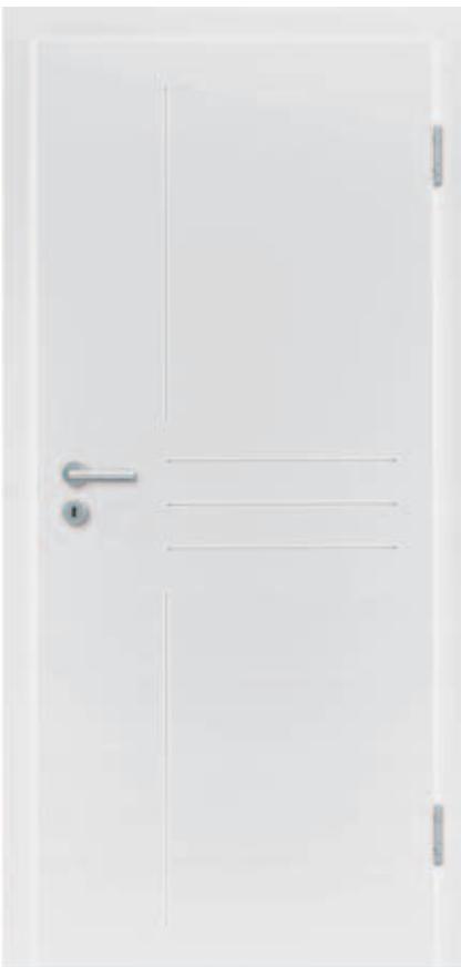
Freestyle 01 WeiBlack