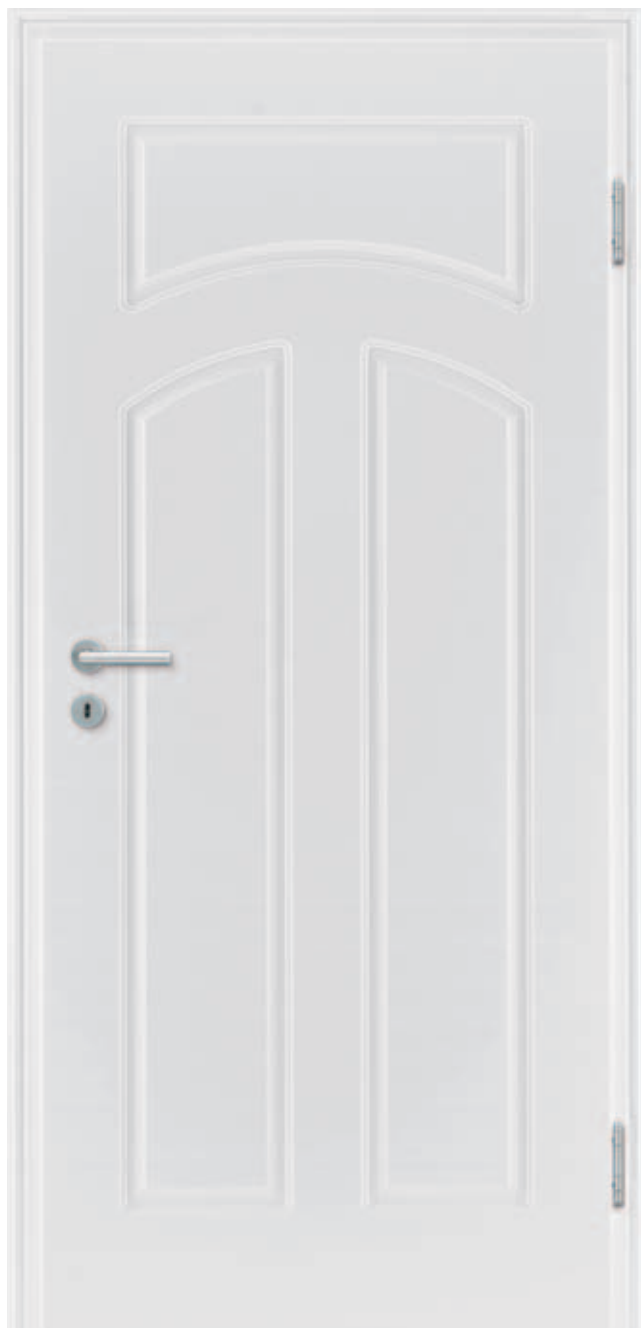
Style 31 Weißlack